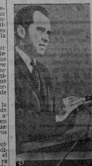
INAUGURACION.—El Vicepresidente Richard M. Nixon aprieta un botón en "The Dalles", Ore., para darle inicio al décimo de las 14 unidades generadoras de energía, mientras inaugura el dique de Dallas de $250.000.000 en el río Columbia entre Oregón y Washington. Cuando todos los generadores estén completos, el dique pondrá un millón de kilovatios de energía eléctrica dentro de un proyectado estancamiento de energía.