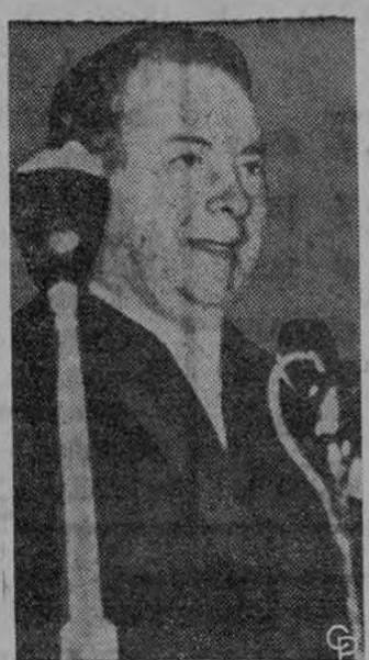
EL GANO PERO SU PARTIDO PERDIO.—Hugh Gaitskell, líder del Partido Laboral británico, aparece en Leeds, Inglaterra, después de haber sido anunciada su victoria personal en su distrito, durante las elecciones nacionales. Los resultados generales no fueron muy buenos para su partido, ya que los Conservadores, dirigidos por el Primer Ministro Harold MacMillan registraron una aplastante victoria en las urnas.

Este documento es propiedad de la Biblioteca Nacional "Miguel Obregón Lizano" del Sistema Nacional de Bibliotecas del Ministerio de Cultura y Juventud, Costa Rica.